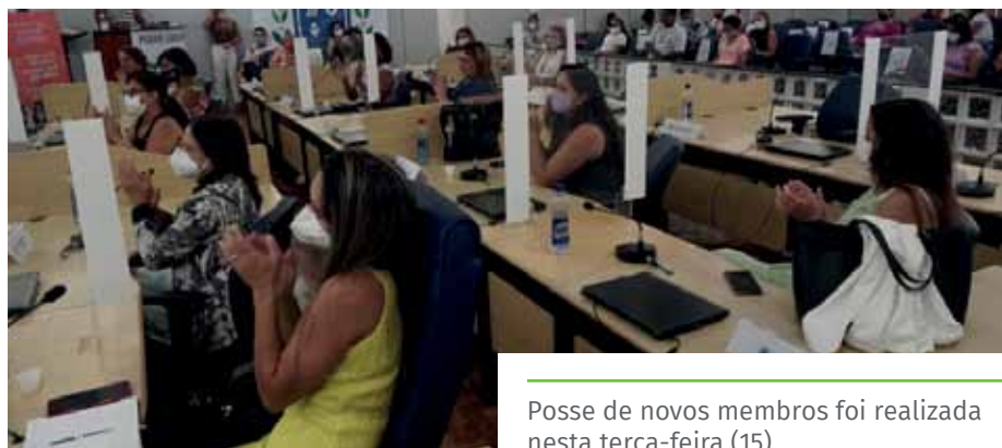
Posse de novos membros foi realizada nesta terça-feira (15)