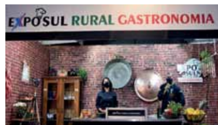
Aulas show com chefs renomados da região farão parte da programação do evento

A Exposul Gastronomia é uma realização da Prefeitura de Cachoeiro e do Sindicato Rural do município. O evento tem o apoio das principais instituições do setor, como Sebrae, Aderes, Senar e OCB, e patrocínio da BRK e Sicoob.