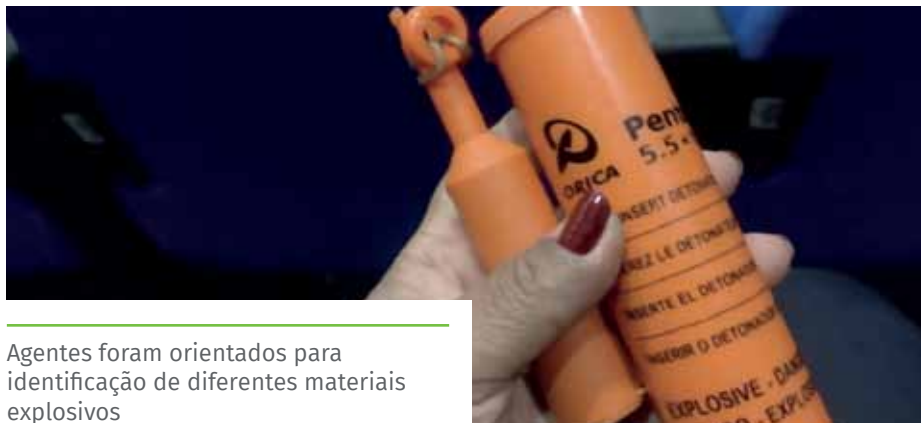
Agentes foram orientados para identificação de diferentes materiais explosivos

inicial às forças policiais que têm a competência funcional e operacional para atender esse tipo de ocorrência e, principalmente, zelando pela proteção e integridade das pessoas no local”, afirma.