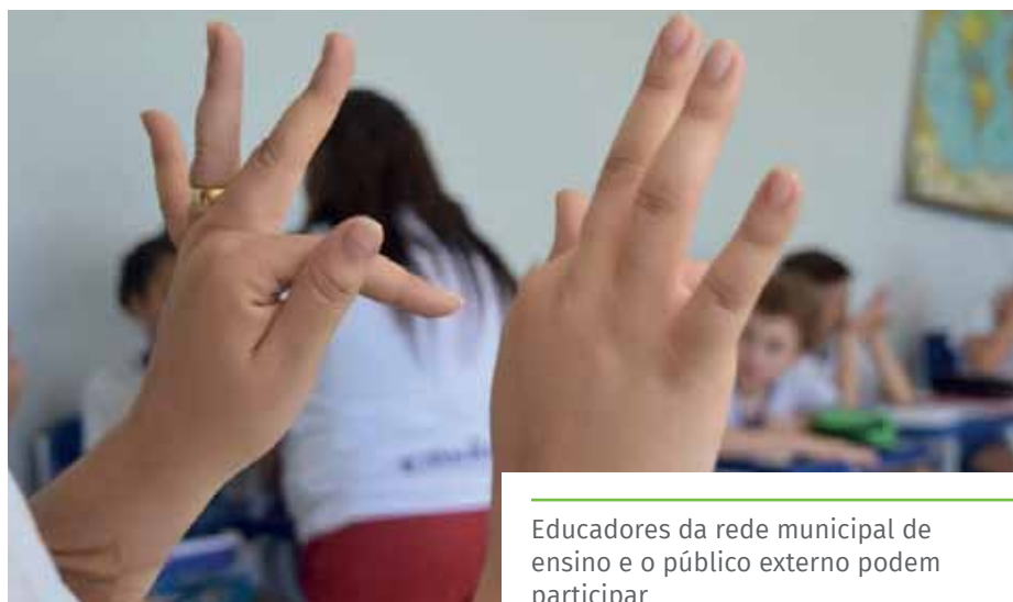
Educadores da rede municipal de ensino e o público externo podem participar