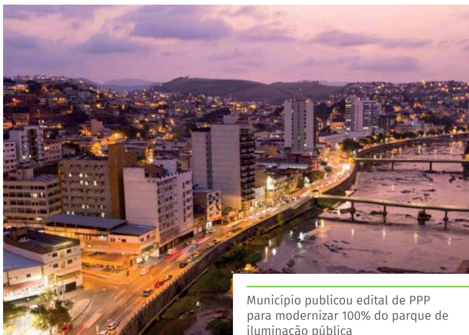
Município publicou edital de PPP para modernizar 100% do parque de iluminação pública

Para apoiar esportistas do município e incentivar práticas esportivas, a Prefeitura lançou novo edital do programa Bolsa Atleta Cachoeiro e realizou a primeira etapa da Temporada de Areia, com competições em diferentes modalidades.