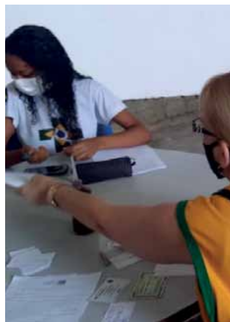
Ação contempla unidades de ensino públicas e particulares

Para que os alunos sejam vacinados, os pais precisam assinar e apresentar termo de consentimento, que é disponibilizado previamente pelas escolas.