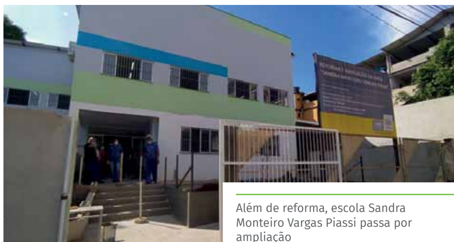
Além de reforma, escola Sandra Monteiro Vargas Piassi passa por ampliação