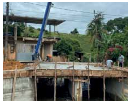
Trabalho teve como objetivo aumentar a largura da via para 8 metros

Querosene, destruída após chuvas no início deste ano. No local, também foi feito um trabalho de desassoreamento e melhoria da vazão do córrego que passa por baixo da ponte.