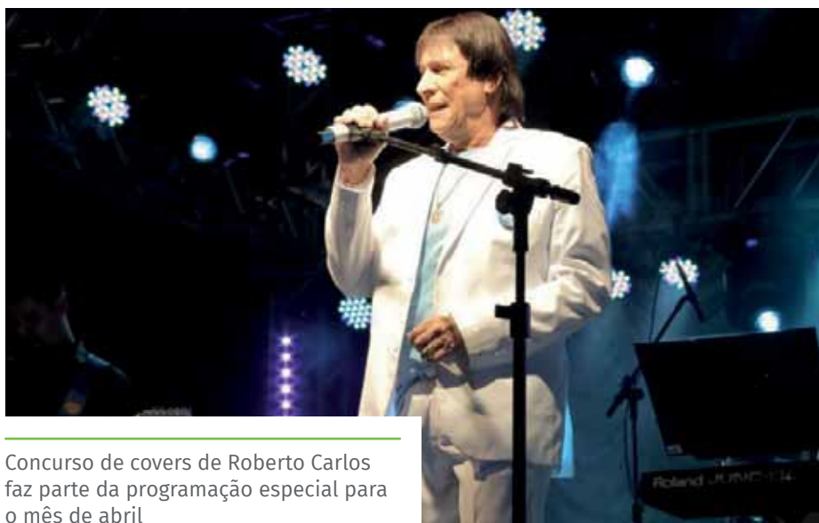
Concurso de covers de Roberto Carlos faz parte da programação especial para o mês de abril

Para participar, as mulheres interessadas devem ter mais de 18 anos e residir em Cachoeiro de Itapemirim. Além disso, a eleita, que receberá um prêmio de R$3 mil, deverá ter disponibilidade para participar dos demais eventos da programação de aniversário de Roberto Carlos.