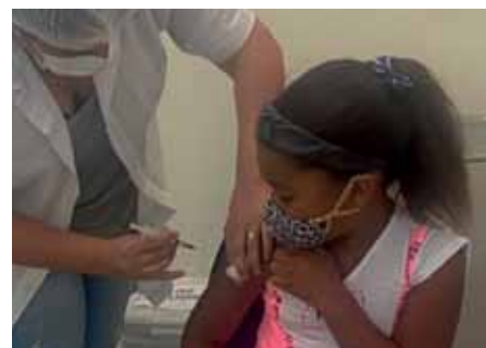
Ação contou com diversos pontos de vacinação, na sede e no interior do município

Em todos os casos, não é preciso fazer agendamento. Basta comparecer ao local de vacinação portando documento de identidade, cartão de vacinas e CPF ou cartão do SUS. Menores de 18 anos devem estar acompanhados de um adulto, e no caso de crianças de 5 a 11 anos, é preciso que os pais ou responsáveis legais autorizem o procedimento presencialmente ou por meio de termo de assentimento por escrito.