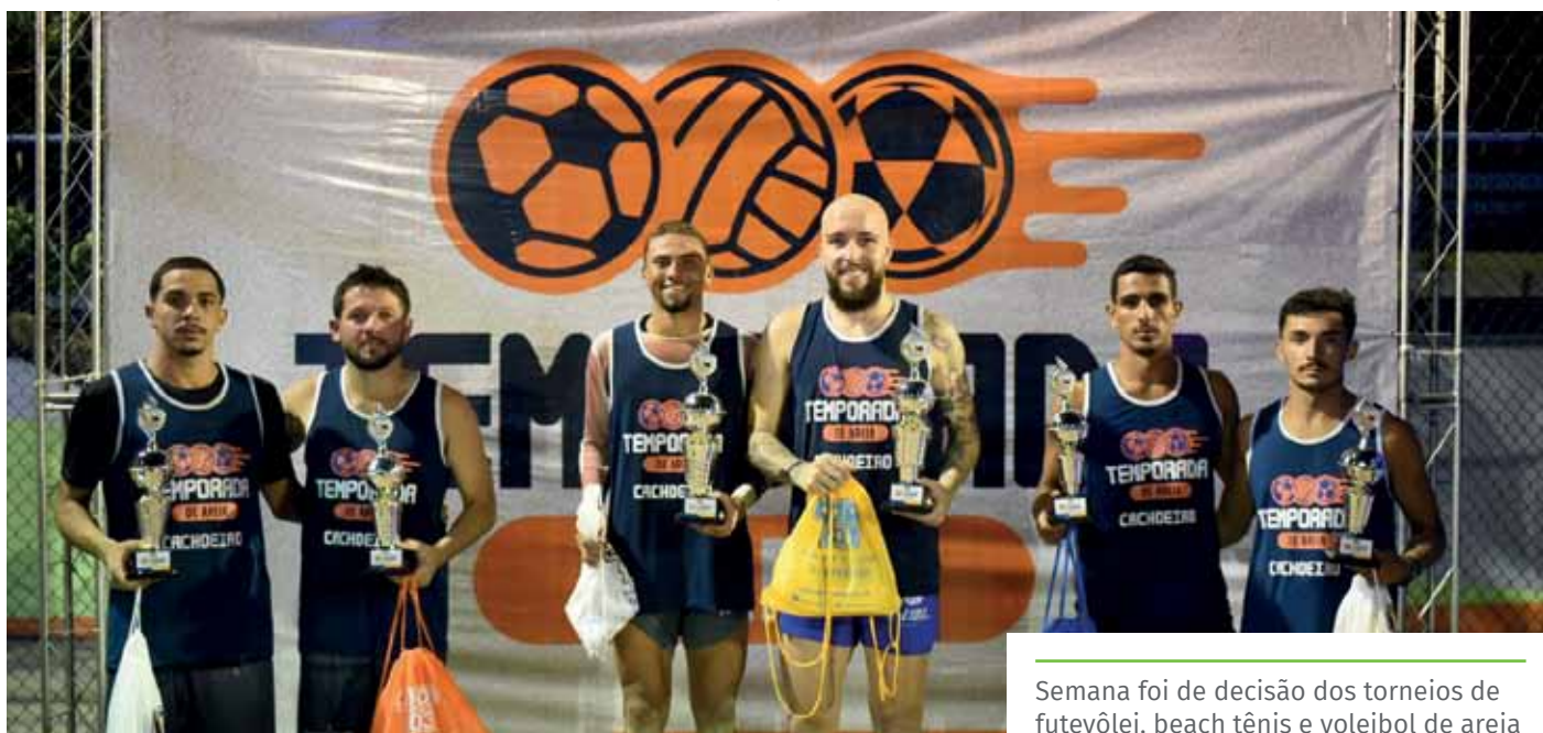
Semana foi de decisão dos torneios de futevôlei, beach tênis e voleibol de areia

17 de março – 17h30 – Partidas finais – Quadra de Areia BNH de Cima