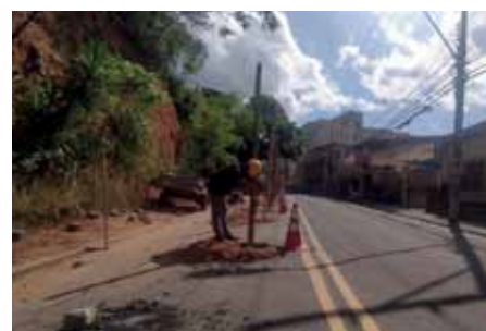
Intervenções contemplam trecho de 200 metros entre padaria e ponto de ônibus