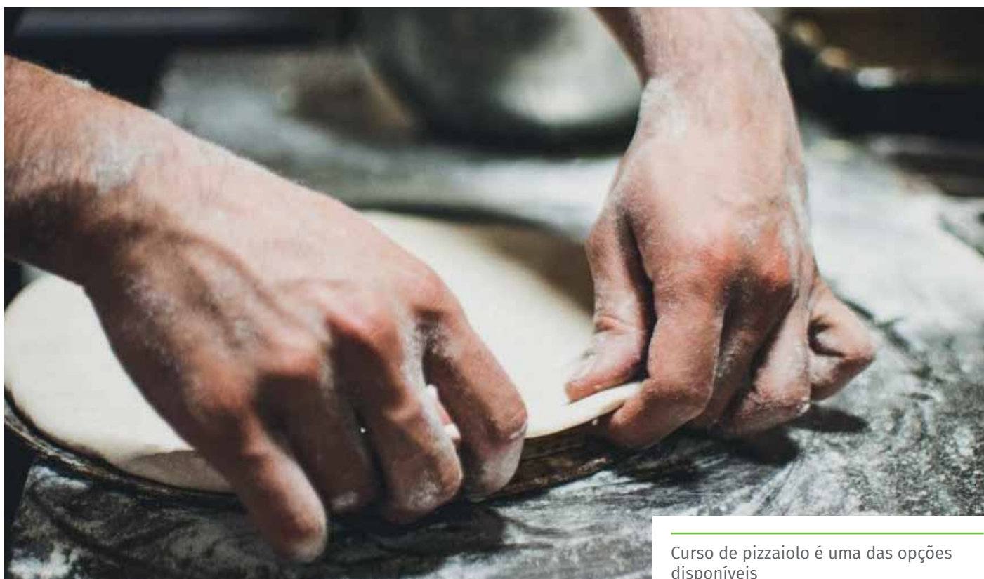
Curso de pizzaiolo é uma das opções disponíveis

Para saber mais informações sobre o Acessuas Trabalho em Cachoeiro, os interessados podem entrar em contato pelo número (28) 3522-5372 ou pelo e-mail: semdes.acessuas@cachoeiro.es.gov.br , de segunda a sexta-feira, de 8h às 14h.