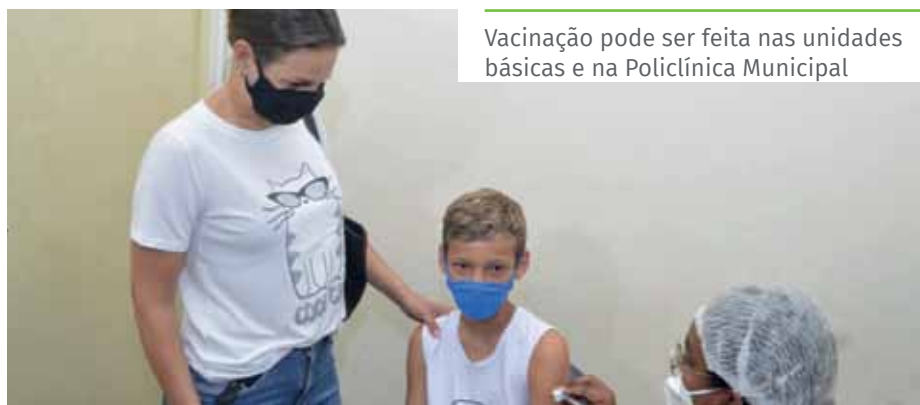
Vacinação pode ser feita nas unidades básicas e na Policlínica Municipal