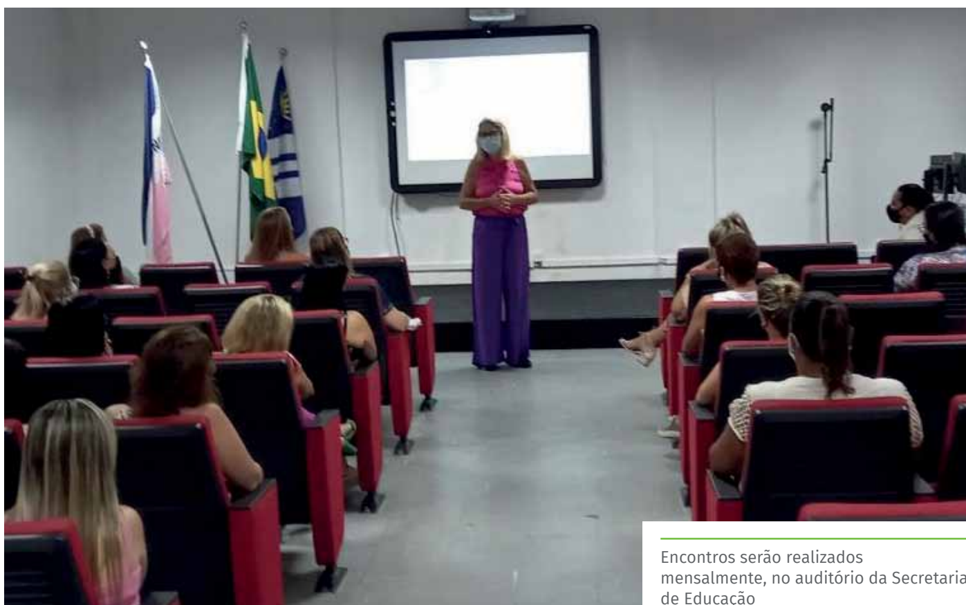
Encontros serão realizados mensalmente, no auditório da Secretaria de Educação