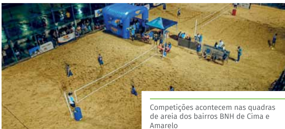
Competições acontecem nas quadras de areia dos bairros BNH de Cima e Amarelo

Para receber o imunizante, é necessário apresentar o cartão de vacina, documento de identificação com foto e cartão do SUS ou o CPF.