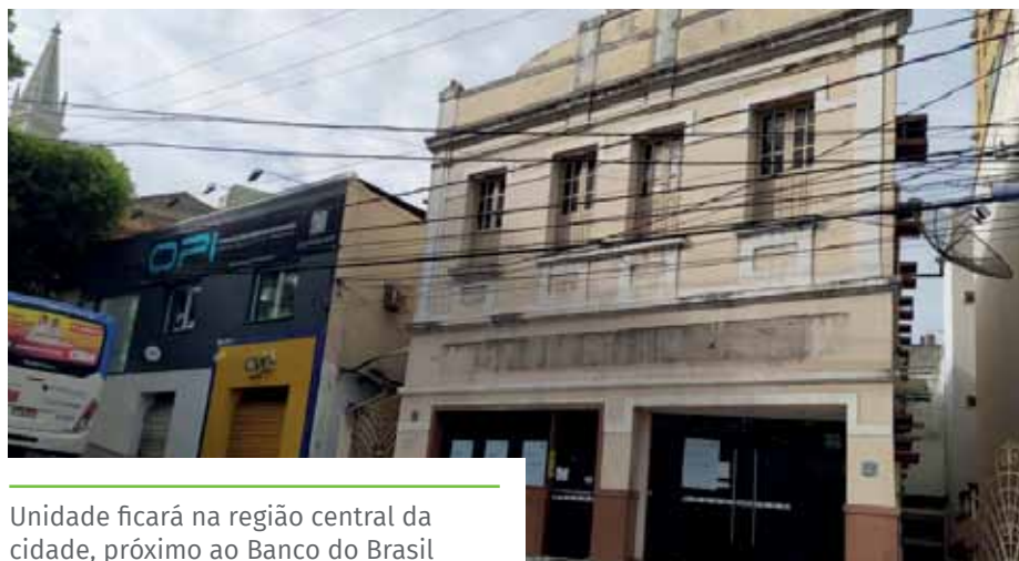
Unidade ficará na região central da cidade, próximo ao Banco do Brasil