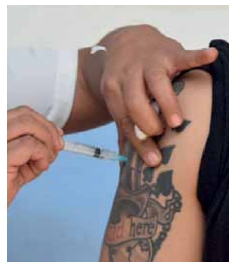
Imunizante será ofertado para o público acima dos 12 anos

16 de março – 17h30 – Partidas finais – Quadra de Areia do BNH de Cima