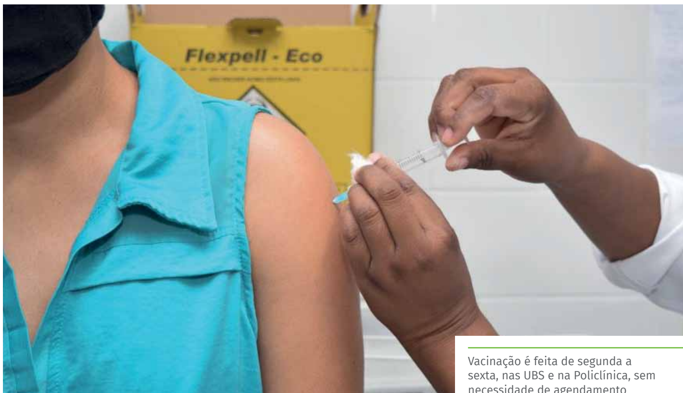
Vacinação é feita de segunda a sexta, nas UBS e na Policlínica, sem necessidade de agendamento

Em março, a Prefeitura de Cachoeiro realizará o sorteio de três smartphones para quem estiver com a vacinação em dia. Poderão participar: adolescentes de 12 a 17 anos que tomarem a primeira ou segunda dose; adultos de 18 a 59 anos que tomarem a dose de reforço – disponível após quatro meses do recebimento da segunda dose – e pessoas de 60 anos ou mais que tomarem a terceira dose (reforço), disponível, para este público, três meses após a segunda aplicação.