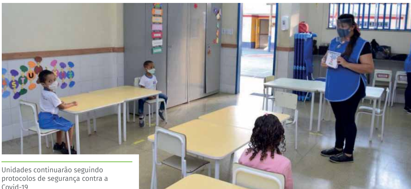
Unidades continuarão seguindo protocolos de segurança contra a Covid-19

No caso de rematrícula, os pais podem procurar a unidade de ensino das 7h às 18h para atualização dos documentos necessários: cópia do cartão de vacina atualizado, acompanhada de declaração expedida pela unidade de saúde e, em caso de alunos com deficiência, o responsável terá que apresentar, também, laudo médico atualizado.