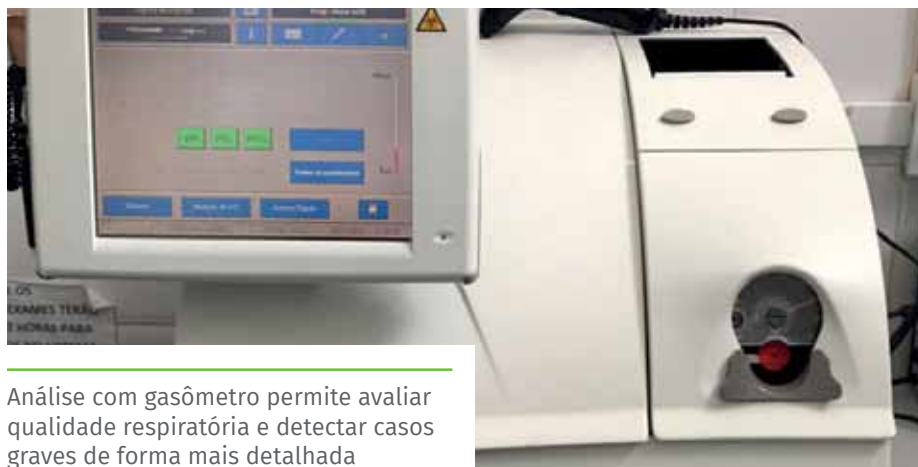
Análise com gasômetro permite avaliar qualidade respiratória e detectar casos graves de forma mais detalhada