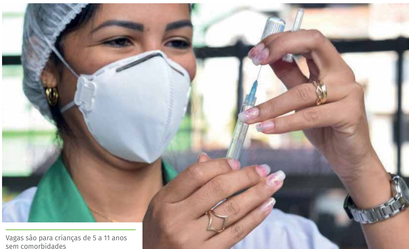
Vagas são para crianças de 5 a 11 anos sem comorbidades

O intervalo entre a primeira e a segunda dose da vacina pediátrica da Pfizer é de oito semanas. No caso da CoronaVac, esse prazo é de 28 dias.