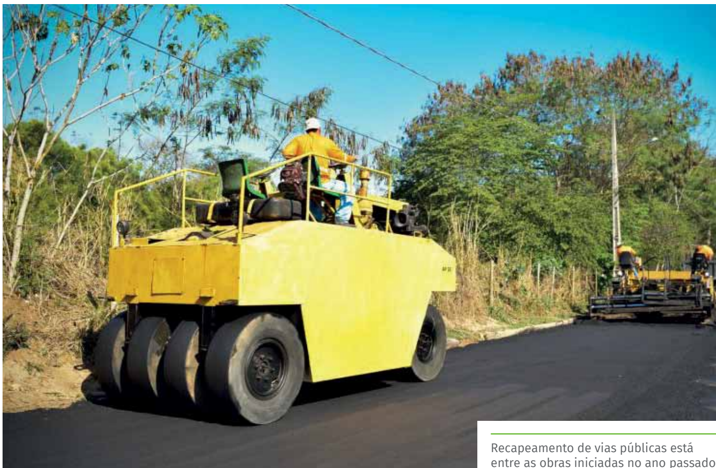
Recapeamento de vias públicas está entre as obras iniciadas no ano passado

“O investimento em obras é um dos pontos centrais da gestão pública municipal. Sabemos o quanto as intervenções são importantes para a população e continuaremos trabalhando para entregar equipamentos públicos de qualidade ao município”, completa o prefeito de Cachoeiro, Víctor Coelho.