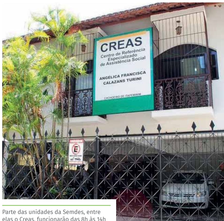
Parte das unidades da Semdes, entre elas o Creas, funcionarão das 8h às 14h

Confira o funcionamento das unidades da Semdes a partir de terça-feira (25), no site: https://www.cachoeiro.es.gov.br/noticias/afastamento-de-servidores-com-sindromes-gripais-faz-setores-mudarem-funcionamento/