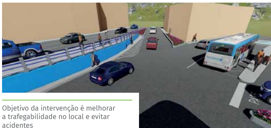
Objetivo da intervenção é melhorar a trafegabilidade no local e evitar acidentes

Confira mais detalhes no site da Prefeitura de Cachoeiro ( www.cachoeiro.es.gov.br ).