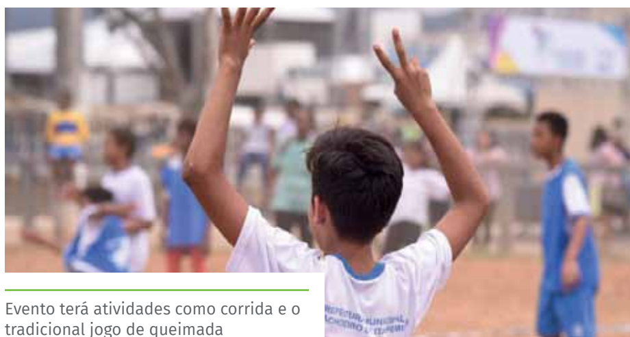
Evento terá atividades como corrida e o tradicional jogo de queimada

*Inicialmente, havia sido divulgado que o Festival Jogos e Brincadeiras seria realizado apenas no dia 17 de janeiro. Entretanto, o projeto será mantido até o dia 28 de janeiro.