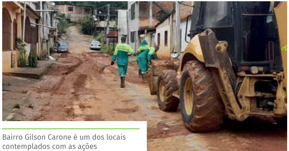
Bairro Gilson Carone é um dos locais contemplados com as ações