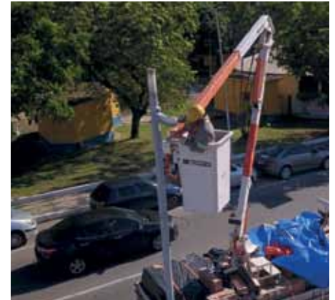
Ações foram iniciadas pela avenida Beira Rio, que terá todos os pontos de iluminação trocados

O valor do contrato é de R$ 9.763.614,32 e tem validade de dois anos. Os serviços de iluminação abrangerão a totalidade do município, que possui 18 mil pontos de iluminação.