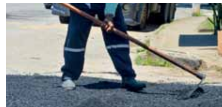
Trabalho continua nas próximas semanas

do IBC e Basileia; obras de drenagem para construção de escadaria no bairro Bela Vista; reparo de galeria no Amarelo; construção de muro no bairro São Francisco de Assis; extensão de drenagem no Santa Helena; reparo de drenagem nos bairros Coramara e Aeroporto e nas avenidas Beira Rio e Francisco Lacerda de Aguiar; capina, roçagem e varrição nos bairros Ibitiquara e Alto Amarelo.