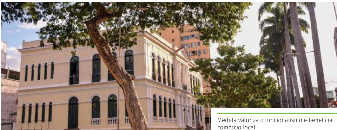
Medida valoriza o funcionalismo e beneficia comércio local