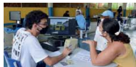
Atendimentos são realizados na escola municipal Zilma Coelho Pinto, das 8h às 20h

No início de agosto, a Prefeitura de Cachoeiro disponibilizou o aplicativo de celular Fazenda Digital Cachoeiro, que pode ser baixado gratuitamente. A ferramenta, desenvolvida pela empresa responsável pelo recadastramento imobiliário no município, permite ao contribuinte solicitar a revisão do valor do IPTU de 2021 sem necessitar de se deslocar até a Semfa.