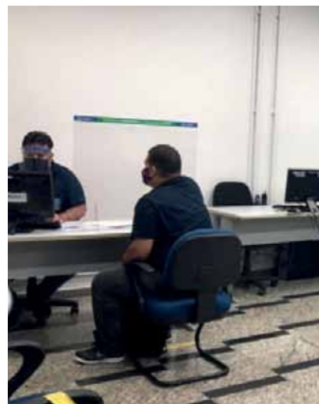
Evento é organizado pela Sala do Empreendedor, em parceria com a Aderes

o programa Oportuni, voltado para facilitar a inserção de jovens no mercado de trabalho.