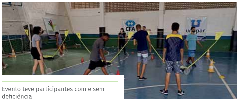
Evento teve participantes com e sem deficiência

Durante o evento, foram seguidos os protocolos de combate à Covid-19, como limitação de público e disponibilidade de álcool em gel para higienização das mãos. O uso de máscaras foi obrigatório.