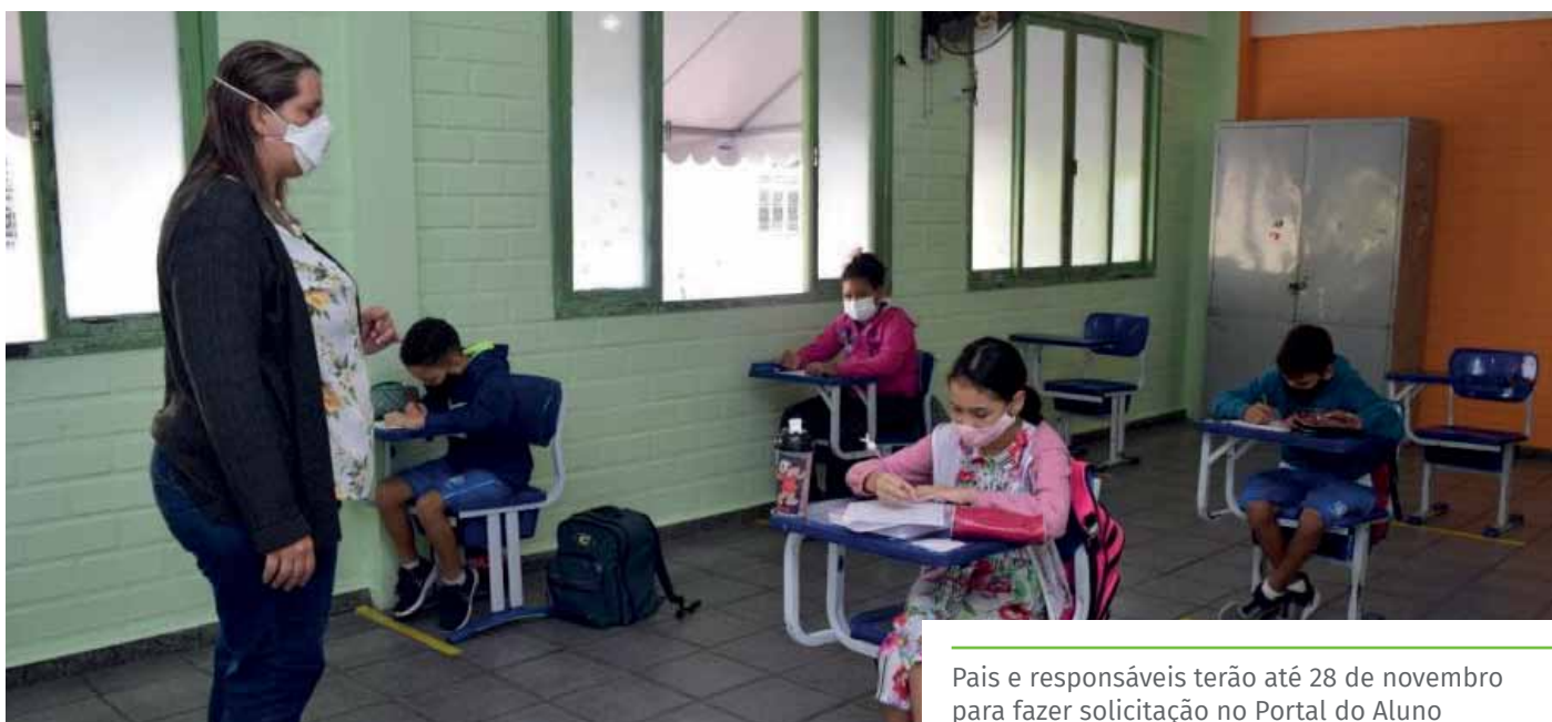
Pais e responsáveis terão até 28 de novembro para fazer solicitação no Portal do Aluno