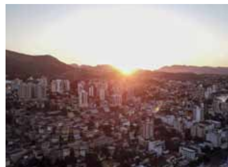
Cidade sul capixaba só ficou atrás de Vitória entre municípios do estado