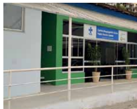
Teste no Centro de Saúde Paulo Pereira Gomes pode ser agendado pela internet, mesmo por quem não apresenta sintomas