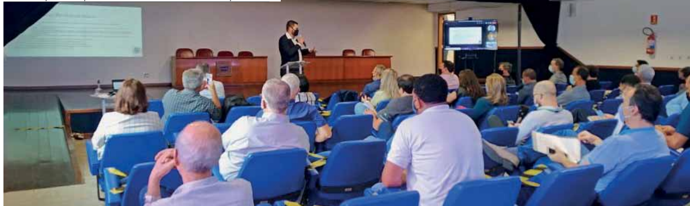
Reunião debateu as mudanças do novo PDM e seus impactos para a economia do município

A quinta audiência pública sobre o processo de revisão e atualização do Plano Diretor Municipal (PDM) de Cachoeiro de Itapemirim será realizada em 4 de novembro, às 19h, pela internet. Para participar, será preciso fazer um pré-cadastro, que poderá ser acessado por meio de um banner na página inicial do site da Prefeitura de Cachoeiro ( www.cachoeiro.es.gov.br ).