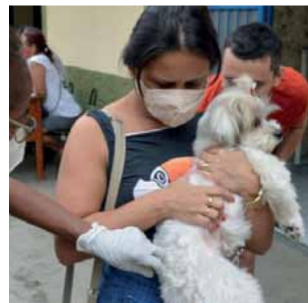
Ação é voltada para cães e gatos a partir dos 3 meses de vida

No último sábado (16), primeira etapa do Dia D de vacinação antirrábica, as equipes da Semus disponibilizaram mais