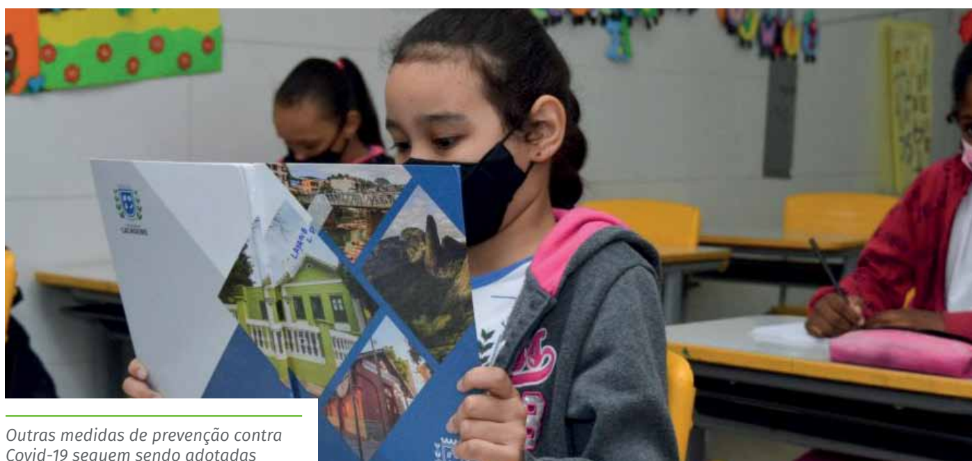
Outras medidas de prevenção contra Covid-19 seguem sendo adotadas

De acordo com a Secretaria Municipal de Educação (Seme), os estudantes que tenham laudo médico, contraindicando a atividade presencial, estarão autorizados a continuar em aulas remotas.