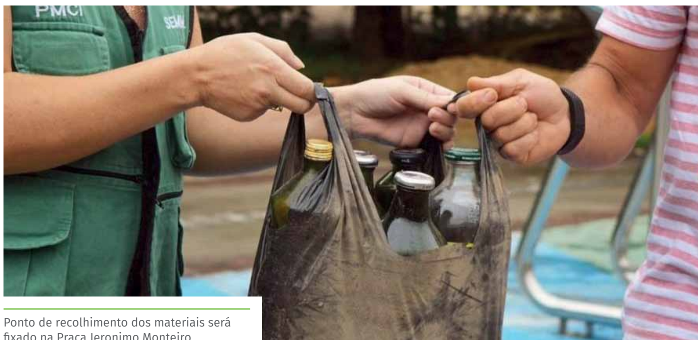
Ponto de recolhimento dos materiais será fixado na Praça Jerônimo Monteiro

Hora: Dias 21 e 22, das 7h às 19h; dia 23, das 09h às 13h