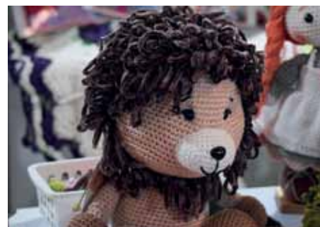
Participação da feira 26 artesãos e trabalhadores manuais

A feira “Art’s Infantil na Praça” é uma parceria da Semdec com a Associação Comercial, Industrial e de Serviços de Cachoeiro (Acisci), a Agência de Desenvolvimento das Micro e Pequenas Empresas e do Empreendedorismo (Aderes) e o Sebrae-ES.