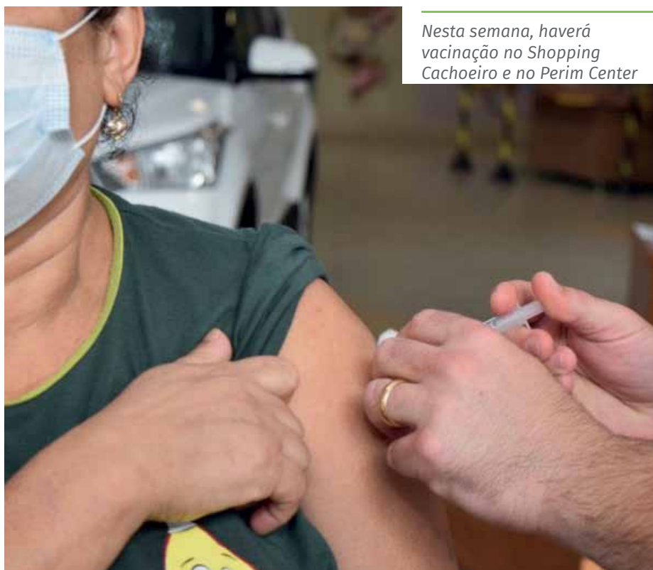
Nesta semana, haverá vacinação no Shopping Cachoeiro e no Perim Center

No caso das pessoas que precisam tomar a segunda dose, poderão se vacinar quem recebeu vacina: da Astrazeneca, há mais de 70 dias (10 semanas); da Pfizer, há mais de 56 dias (8 semanas); da Coronavac, há mais de 28 dias (4 semanas).