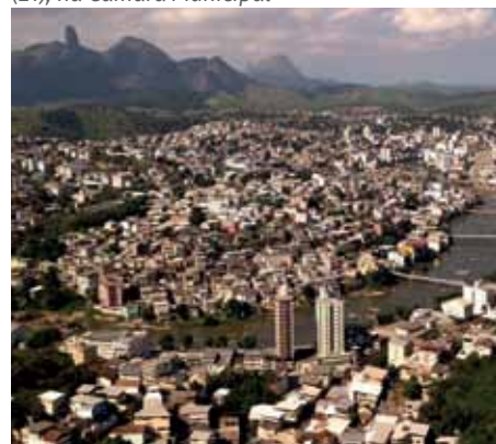
A audiência pública será realizada nesta quinta (21), na Câmara Municipal

Depois de finalizado, o Plano de Contingência será disponibilizado no site da Prefeitura ( www.cachoeiro.es.gov.br ), para que possa ser, permanentemente, consultado por todos.