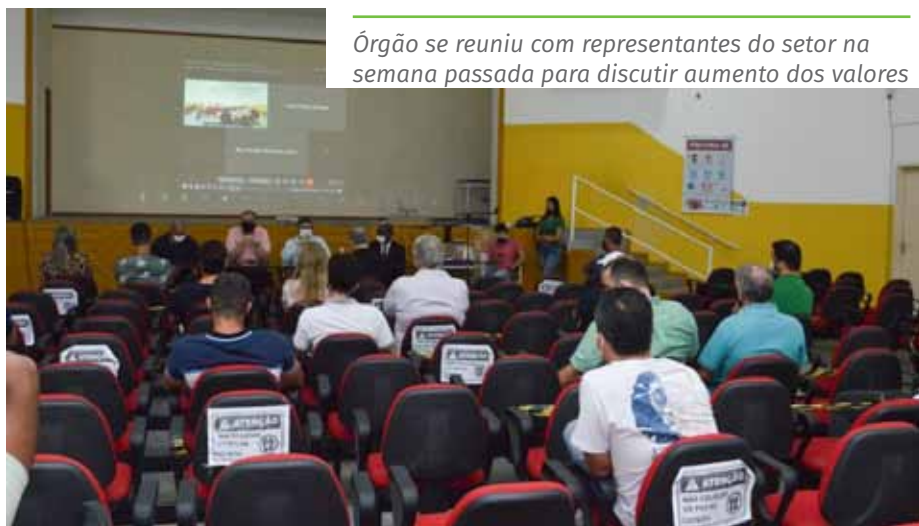
Órgão se reuniu com representantes do setor na semana passada para discutir aumento dos valores

Na ocasião, houve a possibilidade de os proprietários dos postos se explicarem sobre os valores praticados em Cachoeiro, informando que o lucro varia entre 5% a 11%. Além disso, foi sugerida a realização de um encontro do Procon e governo estadual com as distribuidoras, o que deverá acontecer em breve.