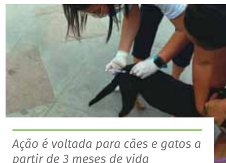
Ação é voltada para cães e gatos a partir de 3 meses de vida

Confira os locais de vacinação no dia 16/10, no portal: www.cachoeiro.es.gov.br/noticias .