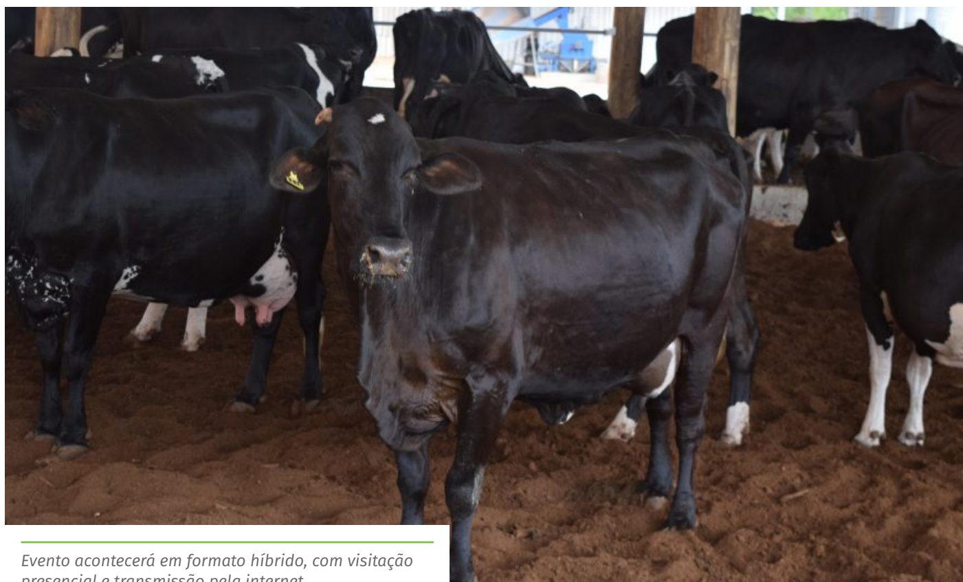
Evento acontecerá em formato híbrido, com visitação presencial e transmissão pela internet

O evento também conta com as parcerias de cooperativas de leite do Espírito Santo; Sistema OCB/Sescoop-ES; Sebrae-ES; Sistema Faes/Senar/Sindicatos; Sicoob Sul; Governo do Estado do Espírito Santo, por meio da Secretaria de Estado da Agricultura (Seag), do Incaper e do IDAF; Fundo Emergencial de Promoção da Saúde Animal do Estado do Espírito Santo (FEPSA), dentre outras.