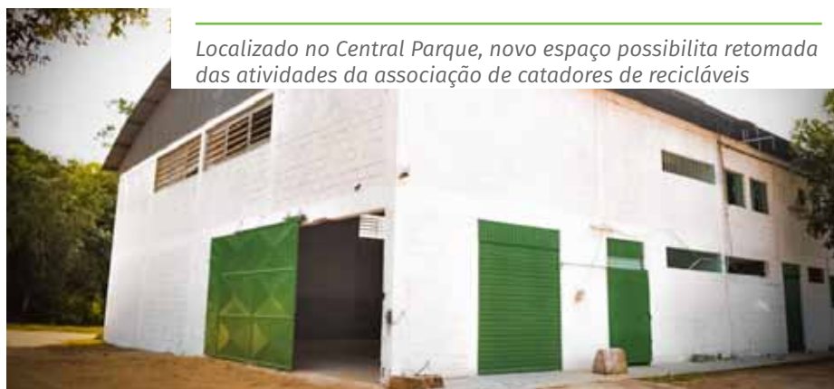
Localizado no Central Parque, novo espaço possibilita retomada das atividades da associação de catadores de recicláveis

A separação de materiais recicláveis é fundamental para evitar desperdícios, tornando possível um melhor aproveitamento das matérias primas extraídas do meio ambiente. Quando não descartados corretamente, os resíduos levam décadas ou até séculos para alcançar sua decomposição total. Dessa forma, além de auxiliar na manutenção de uma cidade mais sustentável, a reciclagem ainda ajuda com a geração de renda, visto que há indústrias específicas neste ramo. Em Cachoeiro, a Ascomirim é responsável pelo tratamento adequado para a comercialização do material recolhido.