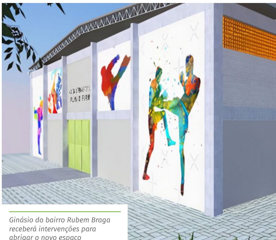
Ginásio do bairro Rubem Braga receberá intervenções para abrigar o novo espaço

As aulas de judô serão iniciadas ainda neste mês, no ginásio do bairro Aquidaban – espaço esportivo cedido pelo município, como contrapartida –, para o público entre 5 e 18 anos.