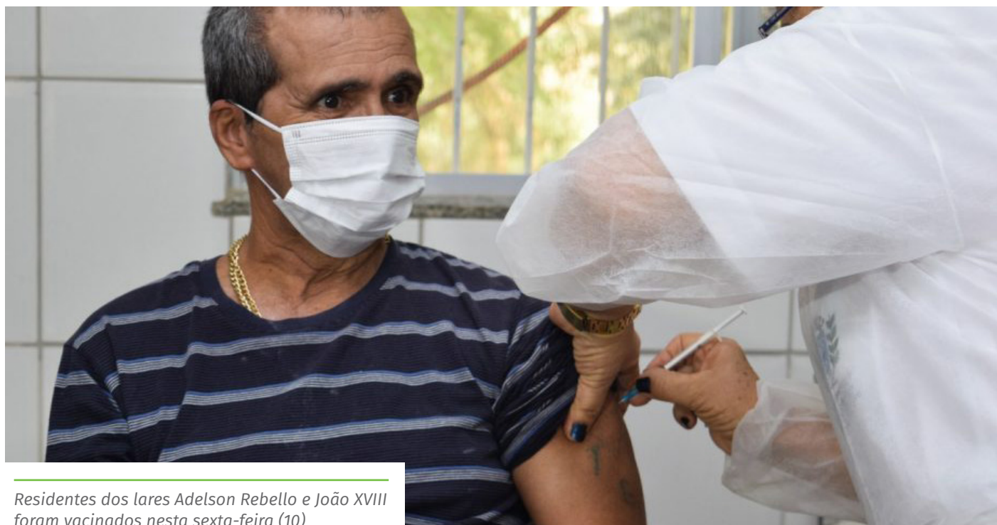
Residentes dos lares Adelson Rebello e João XVIII foram vacinados nesta sexta-feira (10)

Em outra frente, a secretaria fará atendimento domiciliar para imunizar as pessoas acima de 70 anos e os pacientes imunossuprimidos que se encontram acamados. Para isso, é necessário que familiares solicitem o serviço nas unidades básicas de saúde.