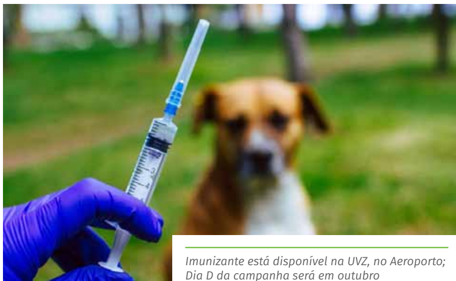
Imunizante está disponível na UVZ, no Aeroporto; Dia D da campanha será em outubro

Não esqueça de levar: documento de identidade com foto do adulto responsável e Cartão de Vacina do pet.