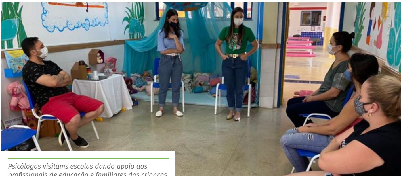
Psicólogas visitam escolas dando apoio aos profissionais de educação e familiares das crianças