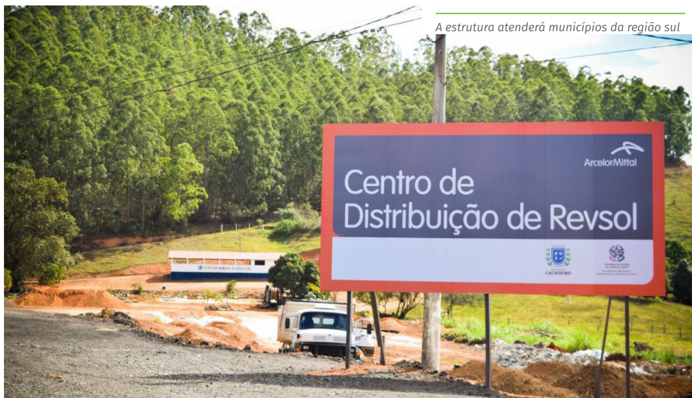
A estrutura atenderá municípios da região sul

O CDR de Cachoeiro de Itapemirim terá capacidade para armazenar até 5 mil toneladas de coprodutos por mês, que atenderão também, inicialmente, aos municípios de Atilio Vivacqua, Muqui, Mimoso do Sul, Castelo, Vargem Alta, Alegre e Rio Novo do Sul, além de obras da Secretaria de Estado da Agricultura, Abastecimento, Aquicultura e Pesca (Seag) e do Departamento de Edificações e de Rodovias (DER-ES), contribuindo ainda mais para o desenvolvimento do Sul do Estado.