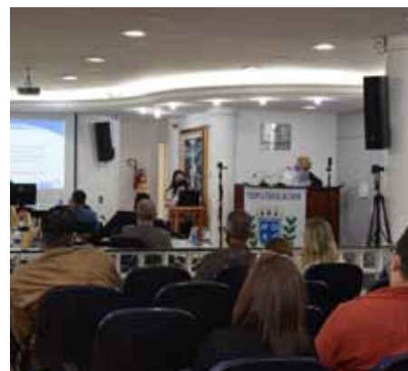
Palestra da secretária de desenvolvimento social apresentou um balanço das políticas públicas voltadas às mulheres do município

Ações dentro da perspectiva da Marcha das Margaridas, movimento nacional de mulheres do campo contra a exploração e todas as formas de violência praticadas contra trabalhadoras rurais. São realizadas palestras sobre empreendedorismo que visam o empoderamento das trabalhadoras rurais.