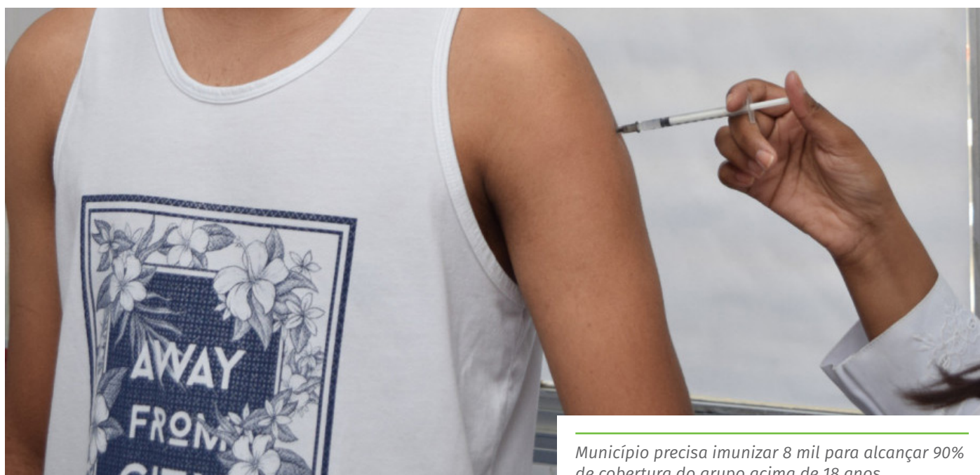
Município precisa imunizar 8 mil para alcançar 90% de cobertura do grupo acima de 18 anos

As pessoas que se vacinam contra a Covid-19, em Cachoeiro, podem colaborar com a campanha “Compartilhe Amor”, doando, no momento da vacinação na unidade de saúde, alimentos não perecíveis e itens de higiene (álcool em gel e sabão), na quantidade que quiserem. A Prefeitura destina todos os produtos arrecadados a famílias em situação de vulnerabilidade social, para reforçar as ações de combate à insegurança alimentar no município durante a pandemia.