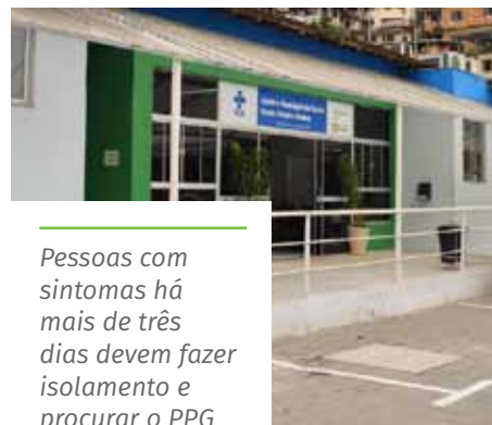
Pessoas com sintomas há mais de três dias devem fazer isolamento e procurar o PPG