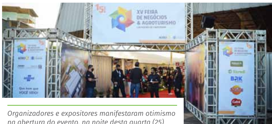
Organizadores e expositores manifestaram otimismo na abertura do evento, na noite desta quarta (25)

A 15ª Feira de Negócios e Agroturismo e Semana do Comércio e do Empreendedor é uma parceria entre Prefeitura de Cachoeiro, Acisci, Sebrae-ES e Aderes.