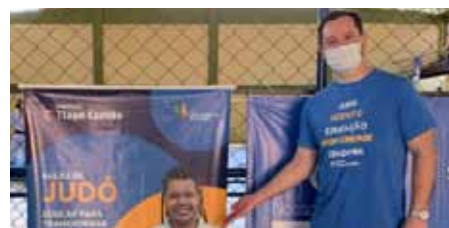
Medalhista olímpico no judô esteve em Cachoeiro no último sábado (14)

“Como pais, temos a expectativa de que as crianças encontrem, no esporte, não apenas o sucesso, que o Tiago Camilo obteve, mas também a disciplina, a educação e tudo de bom que o esporte tem a oferecer para as pessoas. Nós acreditamos muito neste projeto, confiamos que será algo marcante na educação dos nossos meninos”, afirmou Carlos de Andrade Júnior, morador da região.