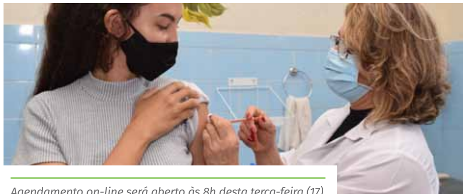
Agendamento on-line será aberto às 8h desta terça-feira (17)

As pessoas que se vacinam contra a Covid-19, em Cachoeiro, podem colaborar com a campanha “Compartilhe Amor”, doando, no momento da vacinação na unidade de saúde, alimentos não perecíveis e itens de higiene (álcool em gel e sabão), na quantidade que quiserem. A Prefeitura destina todos os produtos arrecadados a famílias em situação de vulnerabilidade social, para reforçar as ações de combate à insegurança alimentar no município durante a pandemia.