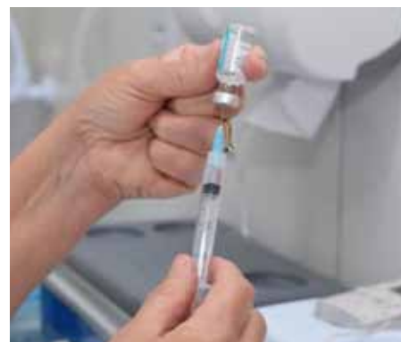
Serão 2 mil vagas para se vacinar em 17 unidades básicas de saúde

Covid-19, em Cachoeiro podem colaborar com a campanha “Compartilhe Amor”, doando, no momento da vacinação na unidade de saúde, alimentos não perecíveis e itens de higiene (álcool em gel e sabão), na quantidade que quiserem. A Prefeitura destina todos os produtos arrecadados a famílias em situação de vulnerabilidade social, para reforçar as ações de combate à insegurança alimentar no município durante a pandemia.