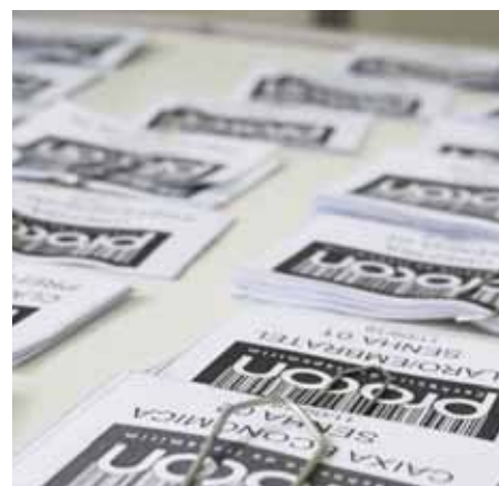
Onze empresas participarão do evento, que acontecerá no Parque de Exposições

Confira as empresas confirmadas e as normas do Mutirão, no link: www.cachoeiro.es.gov.br .