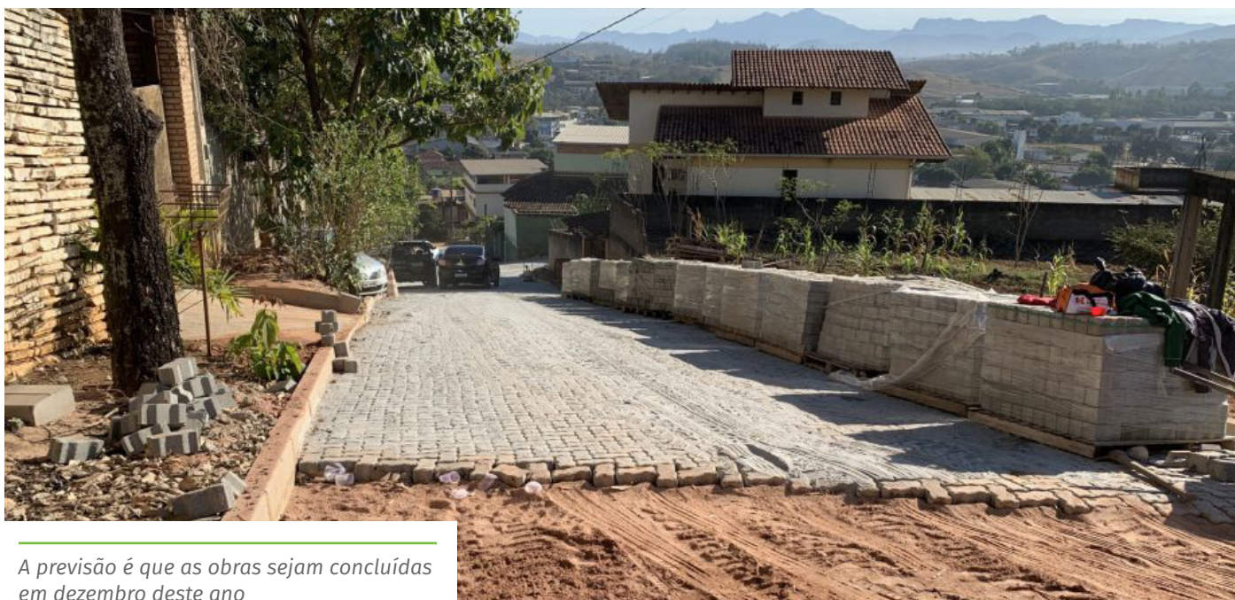
A previsão é que as obras sejam concluídas em dezembro deste ano