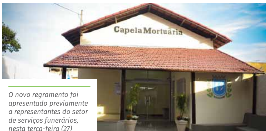
O novo regramento foi apresentado previamente a representantes do setor de serviços funerários, nesta terça-feira (27)

- Constitui obrigação dos serviços funerários e dos cemitérios públicos e privados a afixação e a adoção das normas constantes nesta Portaria, inclusive a Nota Técnica.