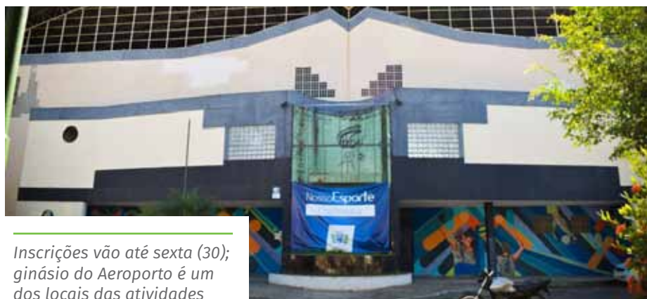
Inscrições vão até sexta (30); ginásio do Aeroporto é um dos locais das atividades

Confira os núcleos educacionais, no link: www.cachoeiro.es.gov.br/noticias .