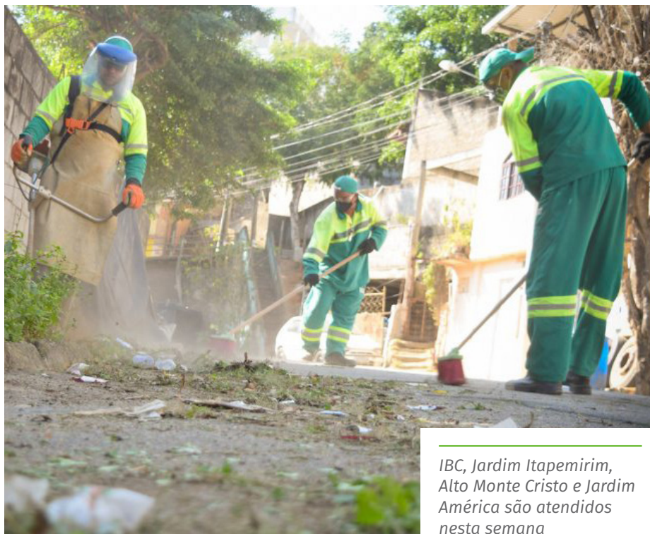
IBC, Jardim Itapemirim, Alto Monte Cristo e Jardim América são atendidos nesta semana