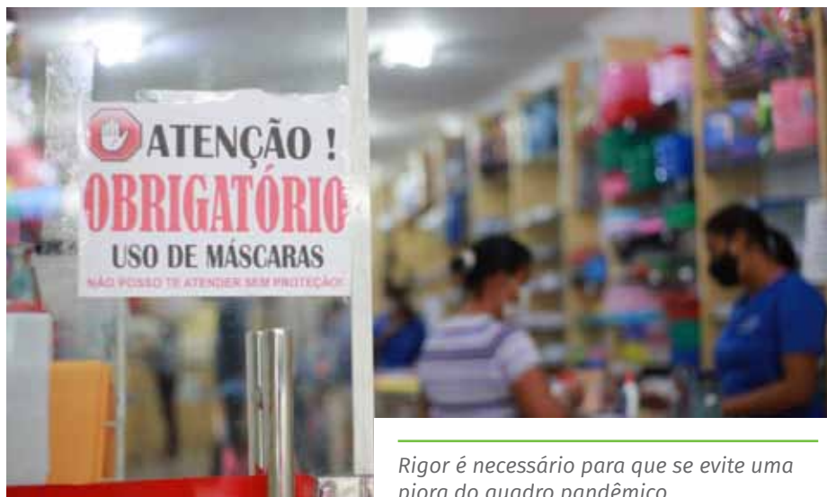
Rigor é necessário para que se evite uma piora do quadro pandêmico

De segunda a sexta-feira, o serviço funciona das 7h às 17h, pelo telefone (28) 98814-3357 (ligação e WhatsApp), pelo Portal do Cidadão ( www.cachoeiro.es.gov.br/ouvidoriageral ), pelo aplicativo de celular Todos Juntos e pelo WhatsApp Cachoeiro Online (98803-9552), na opção 4. Mesmo fora desses horários e aos sábados e domingos, as manifestações poderão ser registradas nos canais digitais.