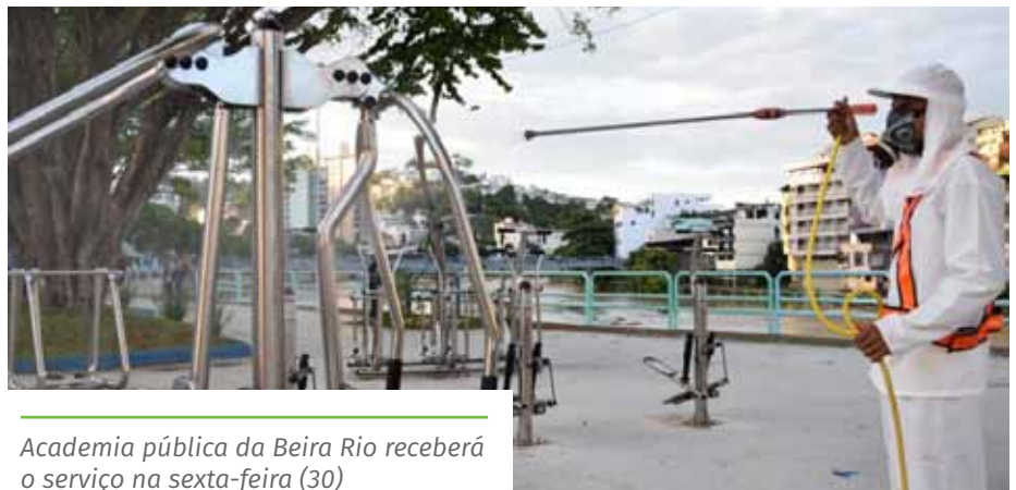
Academia pública da Beira Rio receberá o serviço na sexta-feira (30)

semanalmente, a Prefeitura busca privilegiar os espaços com grande circulação de pessoas, como frentes de hospitais, unidades básicas de saúde, pronto atendimento, pontos de ônibus, entre outros. Para garantir a assepsia, é pulverizada uma solução com hipoclorito de sódio, que é um produto utilizado em todo mundo contra vírus e bactérias. O serviço é realizado a partir das 18h.