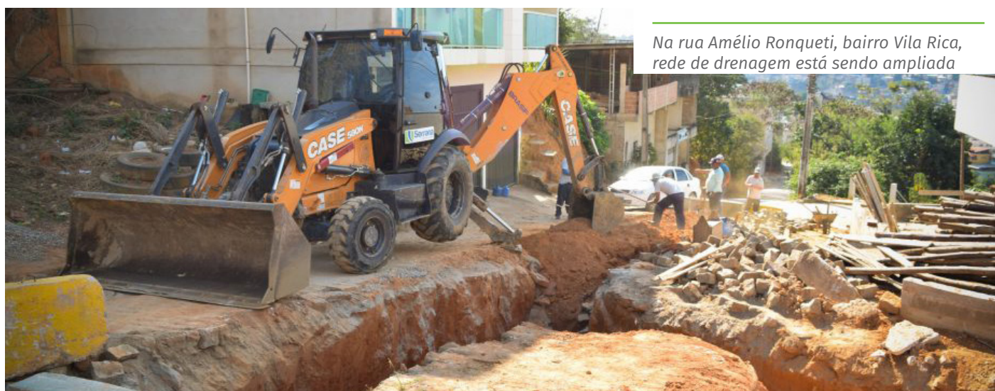
Na rua Amélio Ronqueti, bairro Vila Rica, rede de drenagem está sendo ampliada

A população pode solicitar serviços de manutenção urbana por meio dos seguintes canais da Ouvidoria Geral do Município: telefone 156, Portal do Cidadão, ( www.cachoeiro.es.gov.br/ouvidoriageral ), aplicativo de celular "Todos Juntos" e WhatsApp Cachoeiro Online (98803-9552).