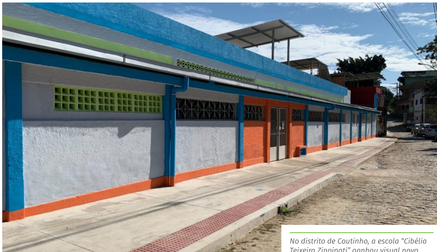
No distrito de Coutinho, a escola “Cibélia Teixeira Zippinoti” ganhou visual novo

A iniciativa também disponibiliza para o município, por meio do governo estadual, material didático para os alunos em fase de alfabetização; recursos financeiros para construção de equipamentos para atender à Educação Infantil e investimento em formação continuada dos professores de alfabetização.