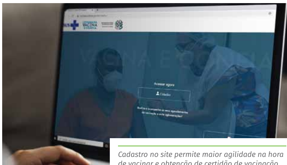
Cadastro no site permite maior agilidade na hora de vacinar e obtenção de certidão de vacinação