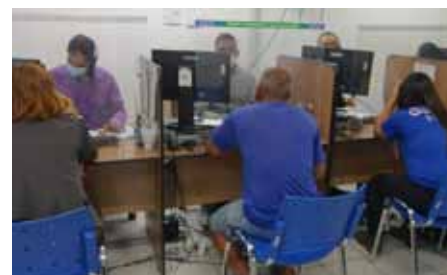
Quem precisa registrar reclamações referentes a relações de consumo já pode se dirigir à agência do órgão

Para mais informações, os consumidores também podem entrar em contato com o Procon pelo telefone (28) 3155-5262.