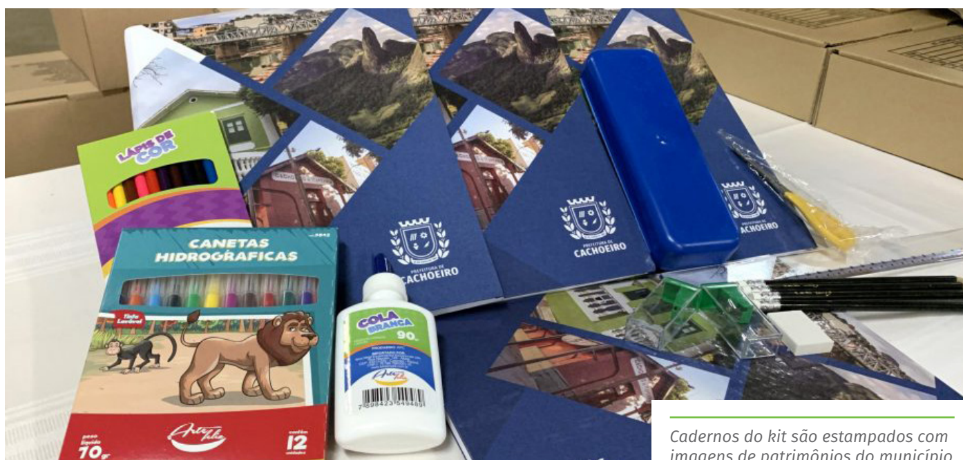
Cadernos do kit são estampados com imagens de patrimônios do município

Os alunos de 6º ao 9º ano receberam apontador, borracha, canetinha hidrográfica, cola branca, caneta esferográfica azul e vermelha, caneca marca texto, lápis de cor, lápis grafite, tesoura sem ponta, conjunto geométrico e estojo escolar.