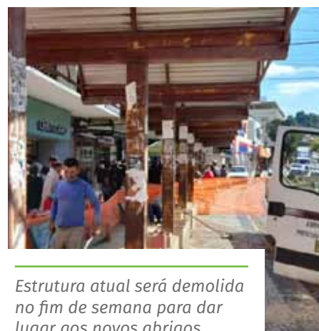
Estrutura atual será demolida no fim de semana para dar lugar aos novos abrigos