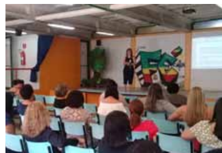
Participaram da formação 140 manipuladoras de alimentos, divididas em quatro grupos

Para garantir a segurança sanitária, as escolas seguem, rigorosamente, os protocolos de saúde, controlando a ocupação dos espaços físicos e estabelecendo horários escalonados para os intervalos e refeições.