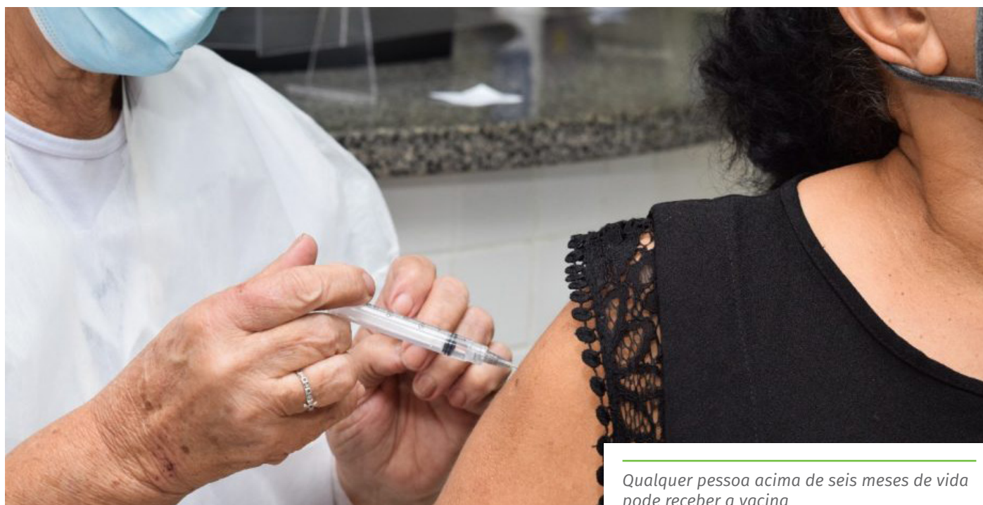
Qualquer pessoa acima de seis meses de vida pode receber a vacina

Confira os locais de vacinação contra a gripe, no link: www.cachoeiro.es.gov.br/noticias