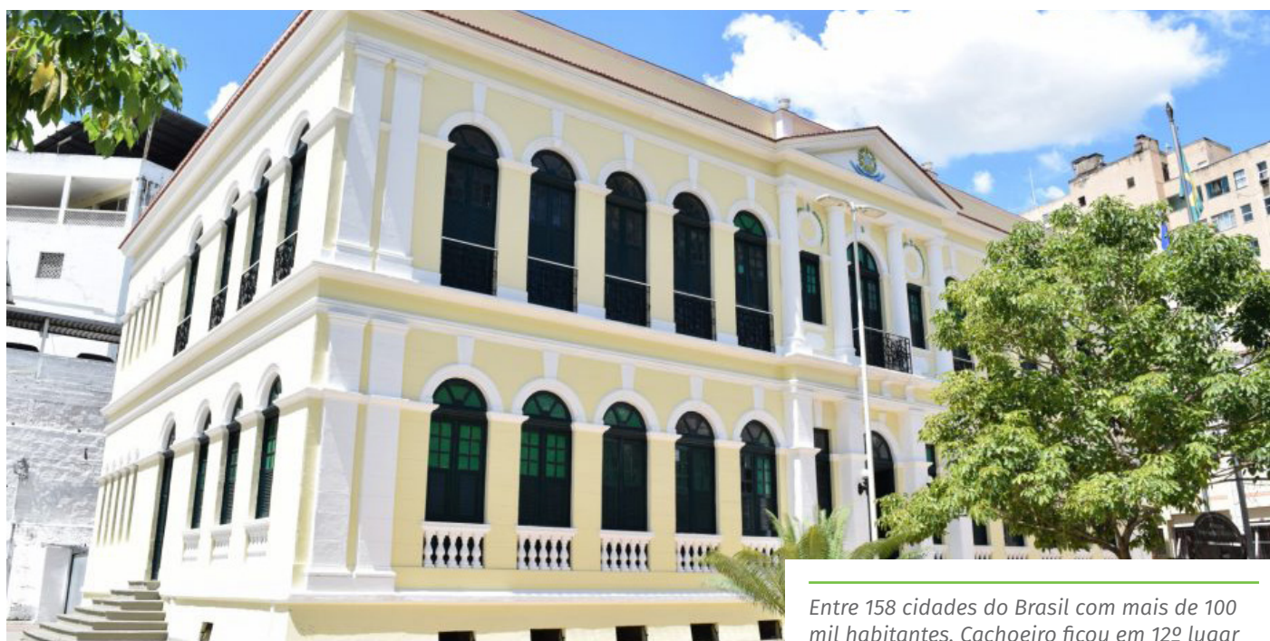
Entre 158 cidades do Brasil com mais de 100 mil habitantes, Cachoeiro ficou em 12º lugar

Mais detalhes sobre o Índice Governança dos Municípios podem ser conferidos no site igm.cfa.org.br . O IGM/CFA de 2021 só está disponível na área de “Acesso Exclusivo”.