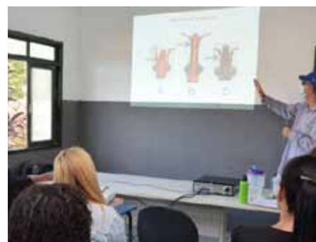
Equipe de Vigilância Ambiental de Cachoeiro participa de treinamento para realizar ação

doenças gravíssimas à população”, afirma o secretário de Saúde de Cachoeiro, Alex Wingler.