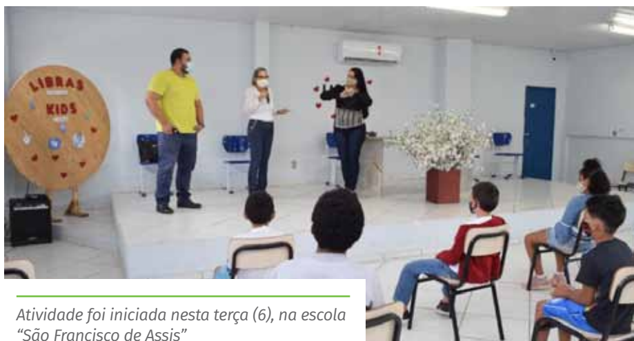
Atividade foi iniciada nesta terça (6), na escola “São Francisco de Assis”