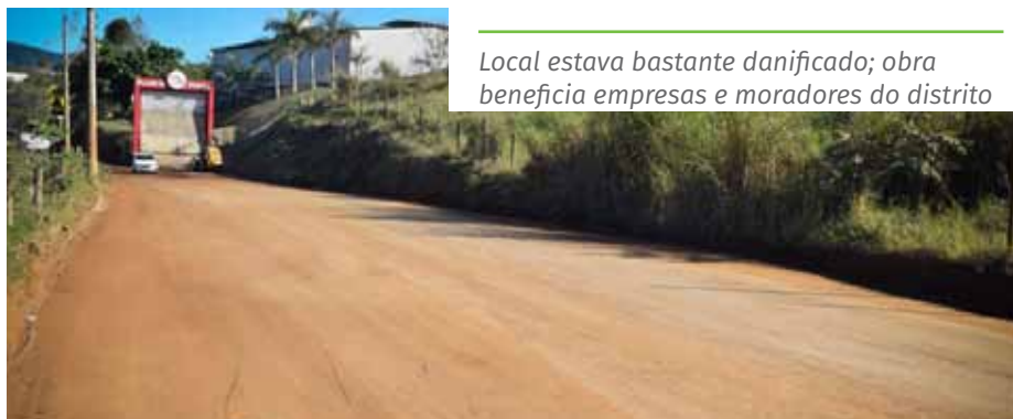
Local estava bastante danificado; obra beneficia empresas e moradores do distrito