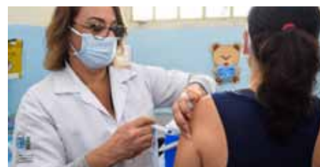
Na semana que vem, outra faixa etária deverá ser contemplada com a vacinação em Cachoeiro

Confira a lista de Unidades Básicas de Saúde para se vacinar (50 a 59 anos), no link: www.cachoeiro.es.gov.br/noticias