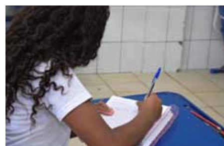
As aulas estão sendo realizadas dentro das regras do modelo de ensino híbrido

As aulas estão sendo realizadas dentro das regras do modelo de ensino híbrido, em que os estudantes alternam uma semana com aulas presenciais e uma semana com ensino remoto.