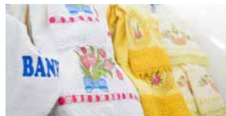
Produtos serão expostos em estandes no Shopping Sul, de 30 de junho a 3 de julho

O público poderá visitar o evento das 14h às 20h e haverá transmissão ao vivo pelo YouTube e redes sociais da ExpoSul, das 15h às 19h. O evento seguirá todos os protocolos de prevenção da Covid-19.