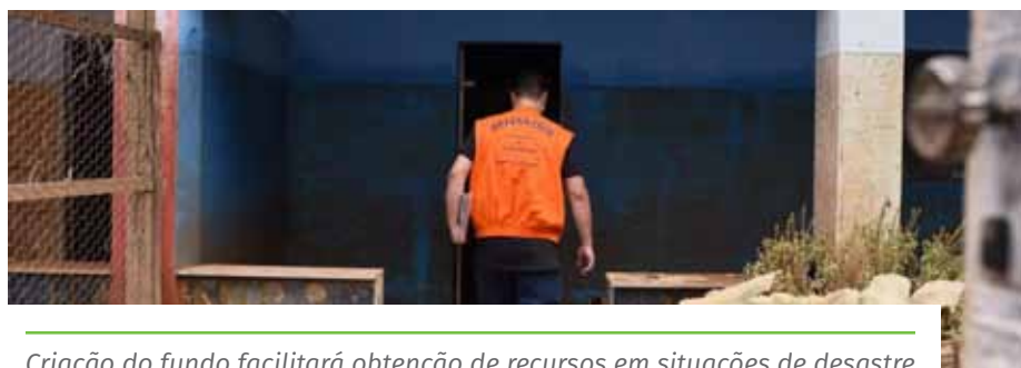
Criação do fundo facilitará obtenção de recursos em situações de desastre