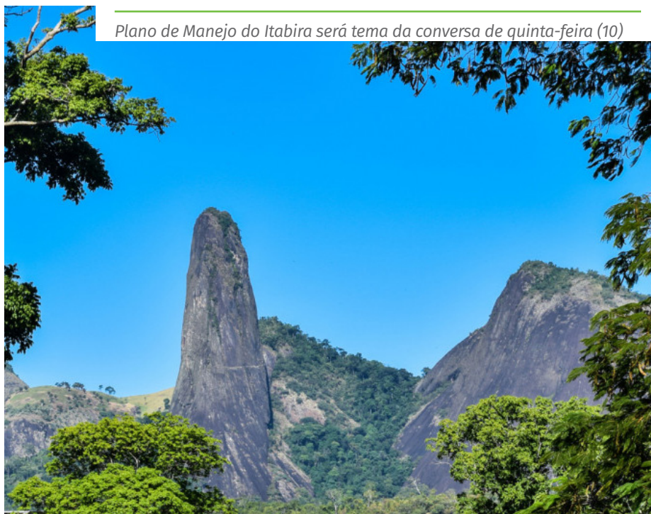
Plano de Manejo do Itabira será tema da conversa de quinta-feira (10)

A limpeza de córrego ocorre, ao longo da semana, no distrito de Soturno. Na quinta (10), às 9h, a Semma entregará kit de proteção de nascente na fazenda da Santa Casa, em Monte Líbano. O kit inclui arame, mourão e grampo, para o cercamento da área do manancial. A iniciativa faz parte do projeto Nascentes Vivas.