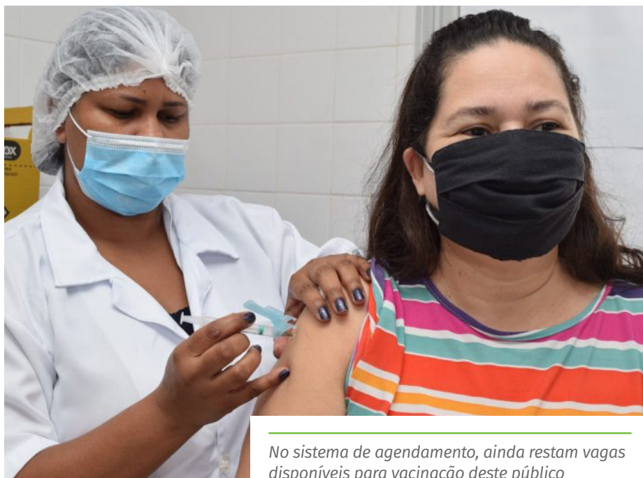
No sistema de agendamento, ainda restam vagas disponíveis para vacinação deste público

Três mil e quatrocentas foram disponibilizadas no sistema de agendamento e 1.705 foram direcionadas para pessoas que moram no interior do município e pacientes acamados, que não estão incluídos no agendamento on-line. Esses dois públicos deverão entrar em contato com a UBS mais próxima para receber instruções sobre o processo de vacinação.