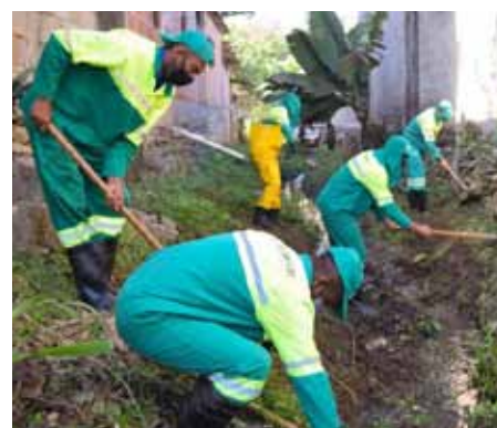
Na ação, é feita a retirada de resíduos acumulados no manancial

locais, o trabalho foi realizado no córrego no bairro Otton Marins. De acordo com as secretarias, o planejamento é fazer a limpeza de outros córregos do município ao longo do ano.