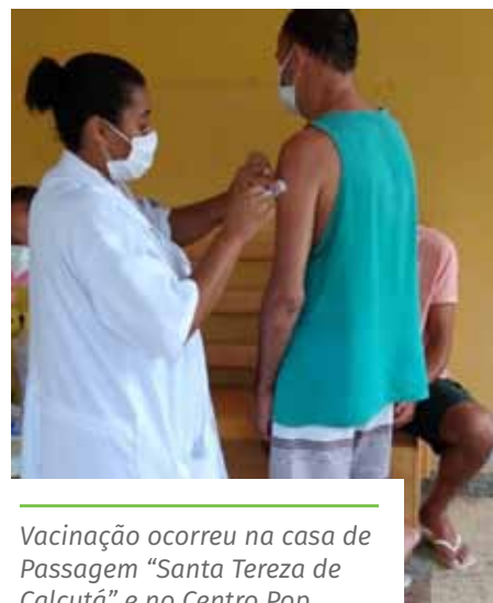
Vacinação ocorreu na casa de Passagem “Santa Tereza de Calcutá” e no Centro Pop

Desenvolvimento Social (Semdes) para imunizar esse público-alvo. A ação também inclui busca ativa.