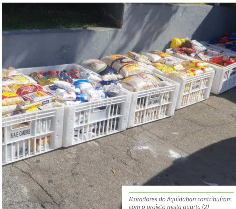
Moradores do Aquidaban contribuíram com o projeto nesta quarta (2)

O “Viva Mais Solidário” faz parte da campanha “Compartilhe Amor”, das secretarias municipais de Desenvolvimento Social e de Saúde, que tem pontos de coleta de alimentos, álcool em gel e sabão nas Unidades Básicas de Saúde (UBS) e nos supermercados Perim de Cachoeiro.